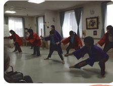
職員による ソーラン節