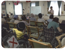
看護師による 〇×クイズ

ル・グランガーデン函南は 9月1日で開設6周年を 迎えることができました。 今後ともご愛顧・ご支援 よろしくお願い致します。