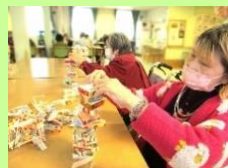
上手く積み上げられたよ～～